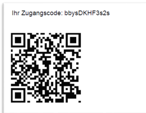
Beispiel QR-Code und Zugangscode

Die Daten sind dabei verschlüsselt und nur mittels Zweifaktor-Authentifizierung einsehbar. Hierfür benötigen Sie die Zugangsdaten (bestehend aus QR-Code und Zugangscode), sowie Ihr Smartphone. Die Zugangsdaten erhalten Sie von Ihrer behandelnden Klinik. Der Aufruf von Meine soH erfolgt über den Internet Browser auf einem beliebigen Gerät (Smartphone, Tablet, PC, etc.)